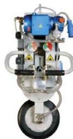
VENTOSE CON ROTAZIONE CONTINUA MANUALE