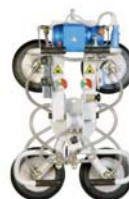
VENTOSE CON ROTAZIONE CONTINUA E BASCULAMENTO MANUALE