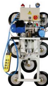
VENTOSE CON ROTAZIONE CONTINUA MANUALE E BASCULAMENTO ELETTRICO