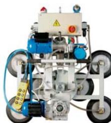
VENTOSE CON ROTAZIONE CONTINUA E BASCULAMENTO ELETTRICO